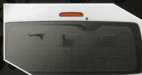
Tipe Hiace dan Hiace Commuter

Keamanan penumpang merupakan hal yang sangat diperhatikan oleh Toyota HIACE untuk memberikan standar kenyamanan maksimum.