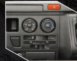
Tipe Hiace Commuter