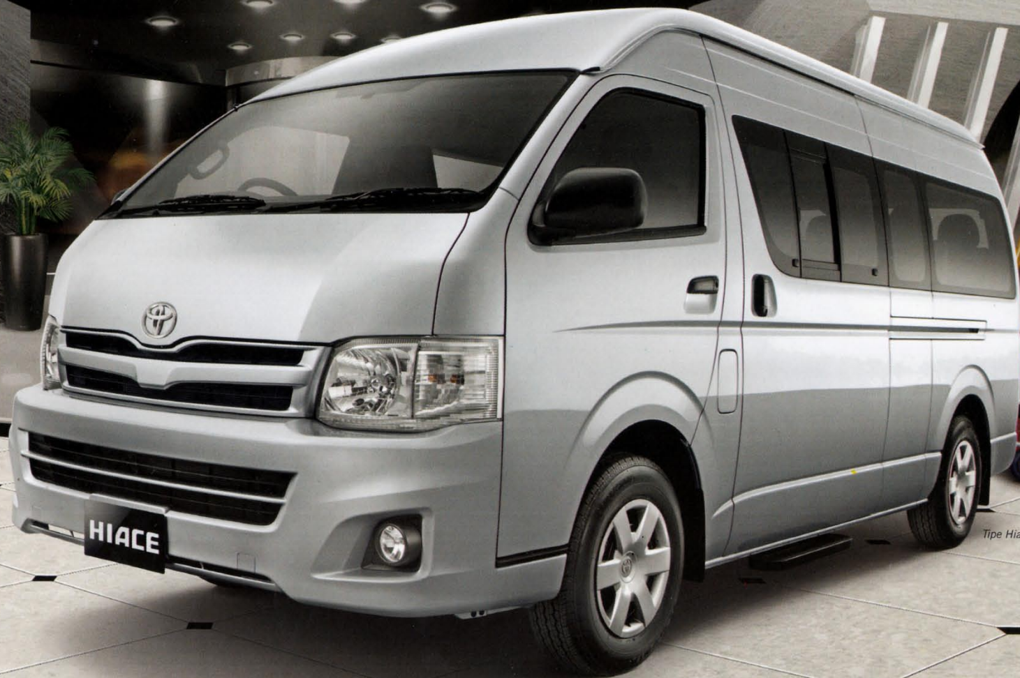
Type Hiace Commuter