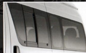
Tipe Hiace dan Hiace Commuter

Tuas gigi yang terletak ditengah console untuk kenyamanan berkendara.