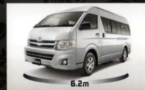
Tipe Hiace dan Hiace Commuter

Performa mesin Diesel 2KD-FTV yang sudah terbukti ketangguhannya dan efisiensi bahan bakar, memenuhi standar EURO-2. Menghasilkan tenaga yang besar namun sangat minim getaran dan suara yang halus untuk kenyamanan dalam berkendara.