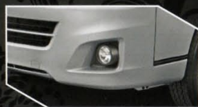
Tipe Hiace Commuter

Tambahan lampu rem belakang untuk memberikan informasi pengereman kendaraan kepada pengemudi di belakangnya.