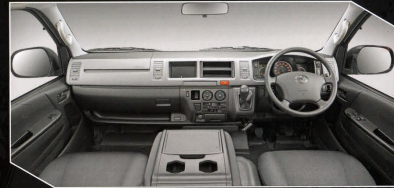
Tipe Hiace Commuter

Dashboard yang ergonomis untuk memberikan informasi dan kenyamanan berkendara yang dilengkapi tempat penyimpanan multifungsi dengan ruang glove box yang besar.