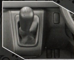
Tipe Hiace dan Hiace Commuter

Dilengkapi auto up and down power window di bagian pengemudi dan power window untuk penumpang depan, memberikan kemudahan dan kenyamanan saat berkendara.