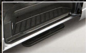
Gambar Tipe Hiace Commuter

Jendela tengah yang dapat dibuka untuk kemudahan dalam aksesibilitas.