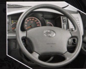
Tipe Hiace dan Hiace Commuter