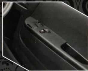
Tipe Hiace Commuter