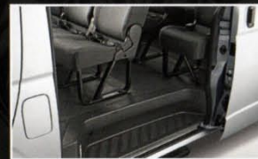
Gambar Tipe Hiace Commuter